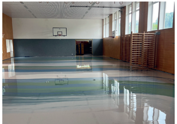
Der neue Belag wird flüssig aufgetragen und härtet dann aus.