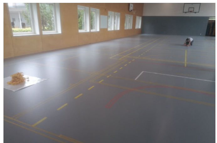
Beim Malen der Linien wurde der graue Boden rings um die farbigen Linien abgeklebt.