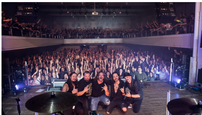
Die Band Megawatt bei einem Auftritt im ausverkauften Casino.

In den gelasseneren Sommermonaten baue er seine Überstunden ab, nehme den Grossteil seiner Urlaubstage und widme sich den anfallenden Unterhaltsarbeiten. «Bei grossen Gebäuden wie dem Casino und dem Alten Zeughaus gibt es immer etwas zu tun. Und es ist unser Anspruch, den Veranstaltern eine attraktive und funktionsfähige Infrastruktur im Kulturzentrum zu bieten.»